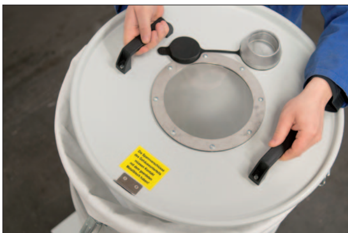
Hõlbus filtrivahetus kaane äratõstmisega