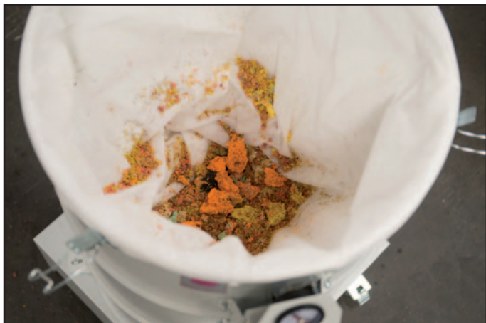
Lõikejääkide kogumine fliisikotti

Seeria DAV-SB tööstusimureid kasutatakse nii ebemete kui lõikejääkide (nt paber, plast, kangas) äratõmbeks tootmisseadmetelt. Imemisvõimsus, konstruktsioon ja mõõtmed on kohandatud kasutatavate tootmismasinate nõuetele. Lõikejäägid imetakse ära ja kogutakse tolmuklassi M filterkotti. Nii ladestub kogutud materjal hästi tihendatult, et filtri mahtu saaks optimaalselt kasutada. Täidetud filtri saab imurist hõlpsasti eemaldada.