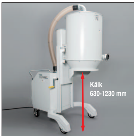
Individuaalselt reguleeritav eraldusplokk