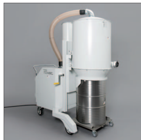
200-liitriline tünn aluskäru