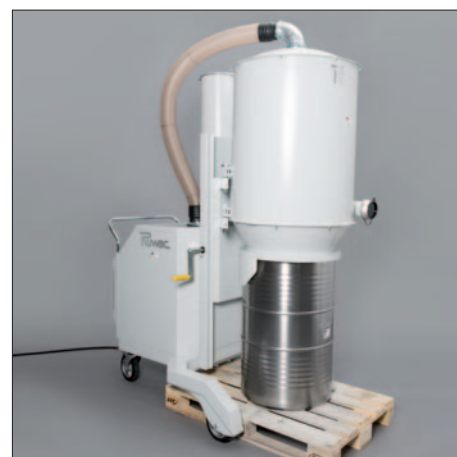
200-liitriline tünn euroalusel