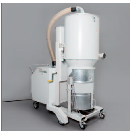
200-liitriline tünn kallutusseadise ja tõstukitaskutega