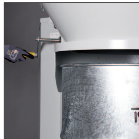
Täpne kohandatavus vastavale eraldusplokile