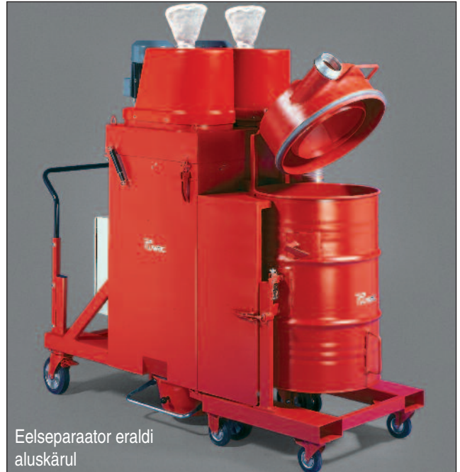
Eelseparaator eraldi aluskärol